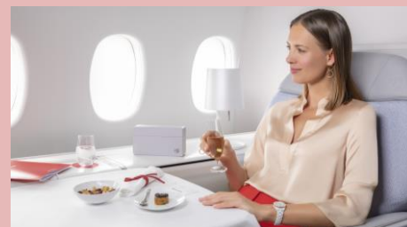
La Première - AF

Genauen Details und Verfügbarkeiten können je nach Flugdatum und spezifischem Flug variieren.