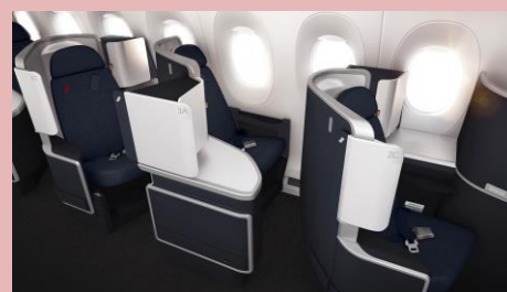
Business Class - AF