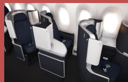
Business Class - AF

Details zu allen Reiseklassen von Air France, KLM und ihren Partnern finden Sie in unserem Klassenbuch .