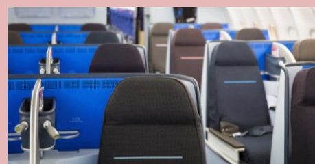
World Business Class - KL